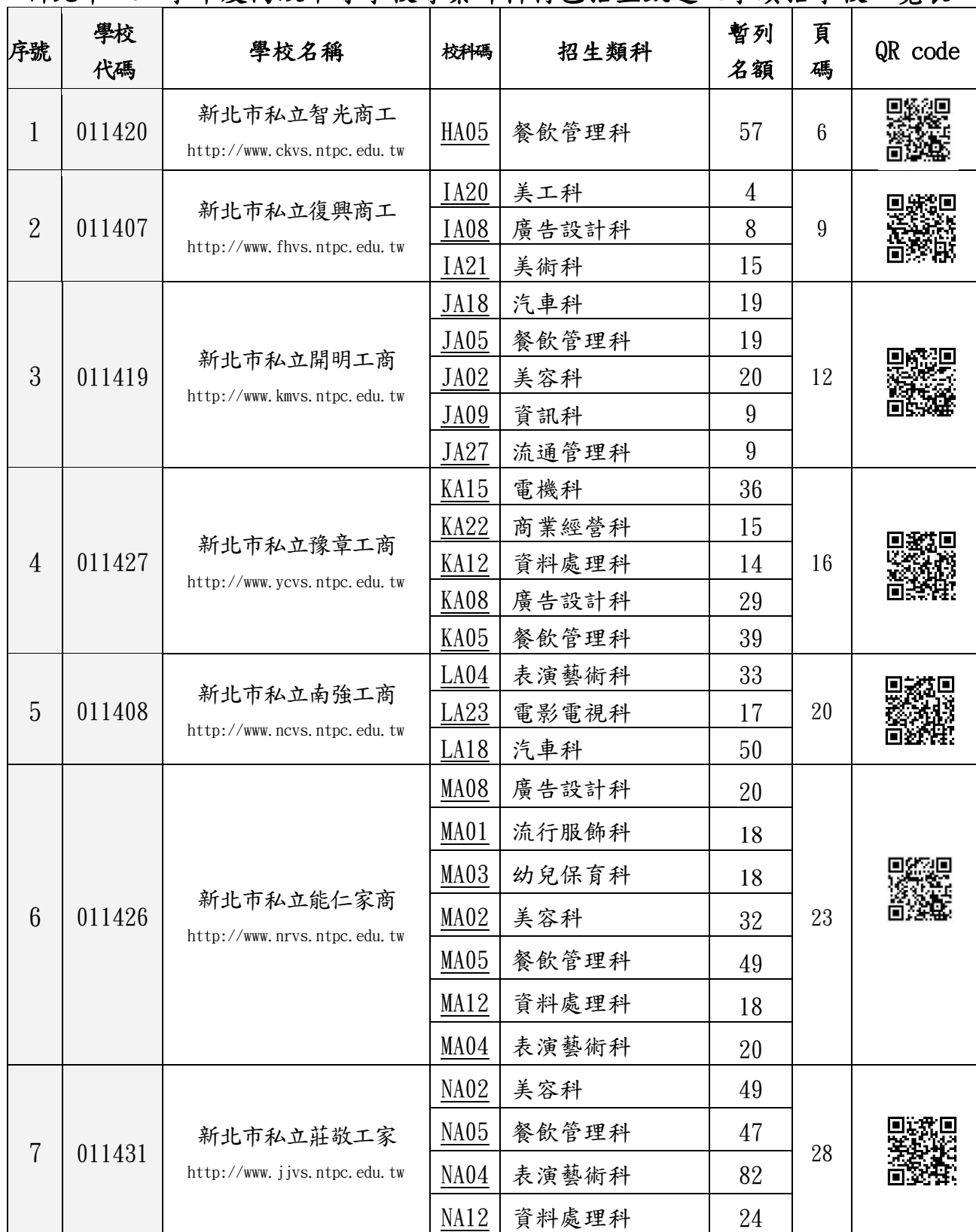
新北市 107 學年度高級中等學校專業群科特色招生甄選入學續招學校一覽表