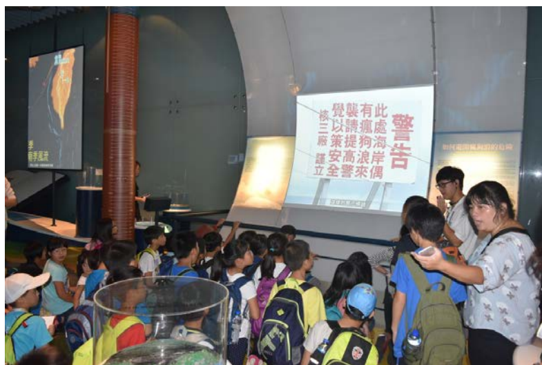
海科館海洋環境廳有關瘋狗浪的展項。